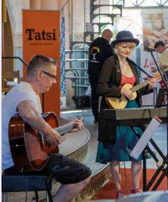
MUSIIKKIDUO JAMIKONA ESIINTYI VUODEN 2022 ERILAISSA MINGLESSÄ.

Kukaan ei valitse köyhyyttä, sairautta tai syrjäytymistä. Työelämän ulkopuolelle tipahtaminen aiheuttaa häpeää, stressiä ja masennusta. On epähuomaania